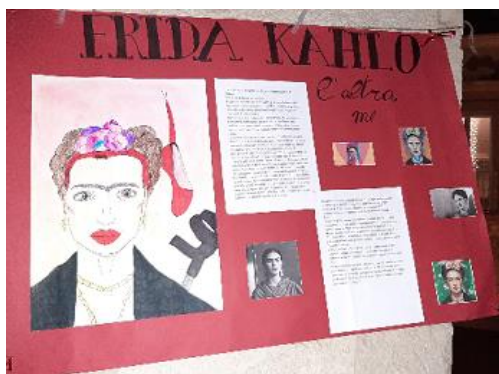
Figure della scienza come Marie Curie, donne di mirabile grandezza poetica come Alda Merini, donne che hanno combattuto contro le mafie come Rita Atria, grandi artiste come Frida Kahlo, donne della nostra grande storia locale come Rosa Pica, fino alla nostra contemporaneità con la figura della scrittrice yemenita Nojoud Ali con il tema delle spose

lingua francese inglese e spagnola, delle arti, presentando figure femminili che, distinte nei vari campi dello scibile, ci testimoniano la loro capacità di autodeterminarsi, opponendosi a convenzioni sociali e a stereotipi di ogni tempo.